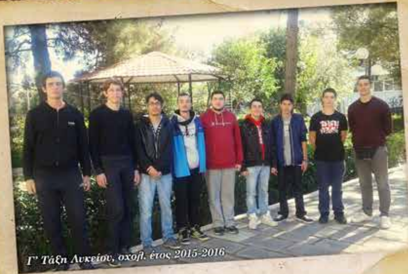
Γ' Τάξη Λυκείου, οχθρ. έτος 2015-2016