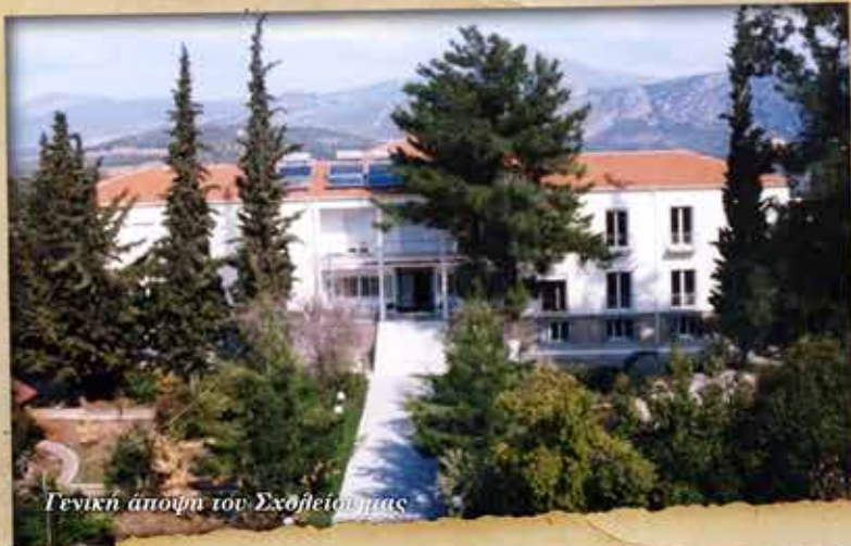
Γενική άποψη του Σχολείου μας